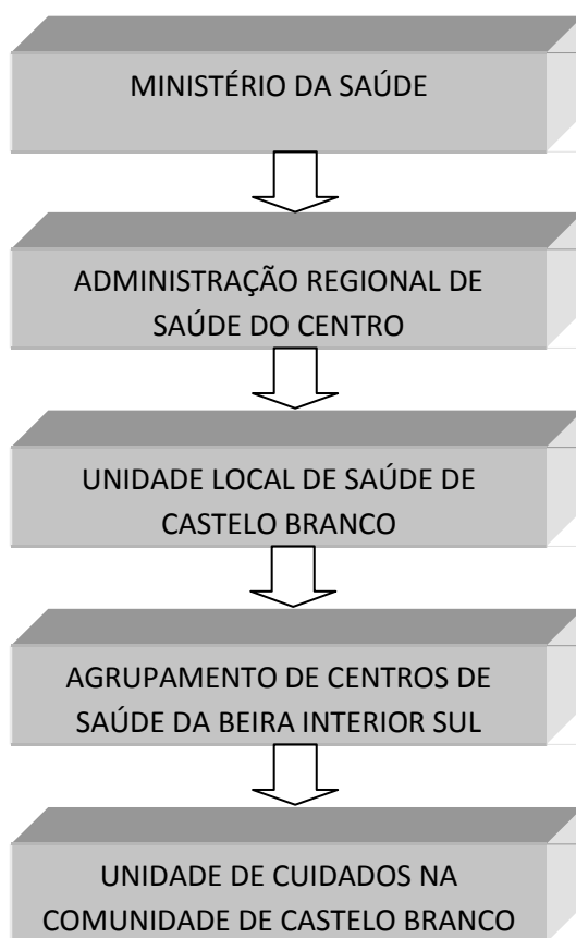
Figura 3 – Organograma da UCCCB