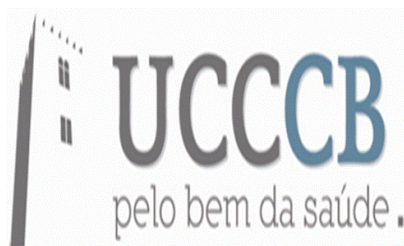
Figura 1 – Logótipo da UCCCB

A obtenção de ganhos em saúde sensíveis aos cuidados prestados pelos colaboradores da UCCCB, será o seu objetivo prioritário.