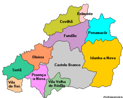
Figura 2 – Mapa do Distrito de Castelo Branco

Os 53731 utentes inscritos nas três unidades de cuidados de saúde personalizados e na unidade de saúde familiar, repartem-se fundamentalmente pelas equipas que exercem a sua atividade na cidade de Castelo Branco, no Centro de Saúde de S. Tiago e no Centro de Saúde de S. Miguel.